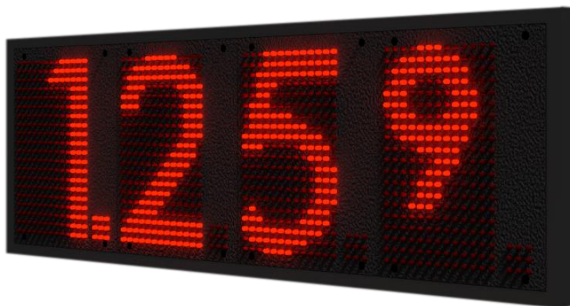
Wyświetlacze serii PM

Seria nowoczesnych wyświetlaczy matrycowych. Charakteryzuje się ona bardzo szczegółowymi czcionkami, o zaokrąglonym kształcie, dzięki zastosowaniu pełnej matrycy z diod LED. Cyfry tej serii, oferują nie tylko możliwość zmiany kroju czcionki 1 , ale także możliwość włączenia/wyłączenia tzw. upper indeksu na ostatniej cyfrze w dowolnym momencie użytkowania.